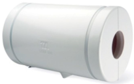
Rørskål afsluttet med plastkappe

Hvis der ikke findes isoleringskapper til de pågældende ventiler og pumper, kan isoleringen udføres med lamelmåtter og pladekapper.