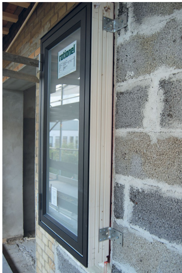
Nyt vindue på nordfacaden af ejendom fra 1970-71

Ved samtidig efterisolering af sokkel opnås yderligere besparelser for reduktion af linietab i samling mellem ydervæg og sokkel. Se energiløsningen ”Efterisolering af sokkel”. Det samme gælder hvis kældervæggen også isoleres udefra.