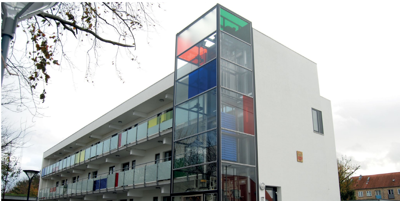
Udvendig facadeisolering med puds på ydervæg med både massive og hulmursisolerede vægge på ejendom fra 1970-71

Den anden mulighed er at anvende et efterisoleringssystem med stiv isolering fastholdt med dybler og afsluttet med puds. Isoleringen kan i dette tilfælde godt være i et lag med omhyggeligt udførte samlinger.