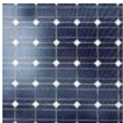
Krystallinsk silicium (mono, poly)

Man skelner normalt mellem de to mest almindelige kategorier af solcelleteknologier, som er: