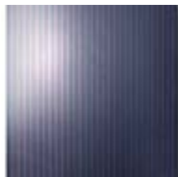
Tyndfilm (amorft silicium, CIS, CdTe)

Moduler med krystallinsk silicium er de ældste, mest udbredte og mest effektive solceller. De kendes på den typiske inddeling i et antal firkantede celler på størrelse med en stor håndflade.