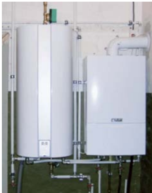
Ny varmtvandsbeholder med ny gaskedel

Når arbejdet er udført, afleveres en brugermanual til kunden. Brugermanualen skal indeholde en beskrivelse af beholderen (inkl. tekniske data), sikkerhedsforskrifter og en betjeningsvejledning.