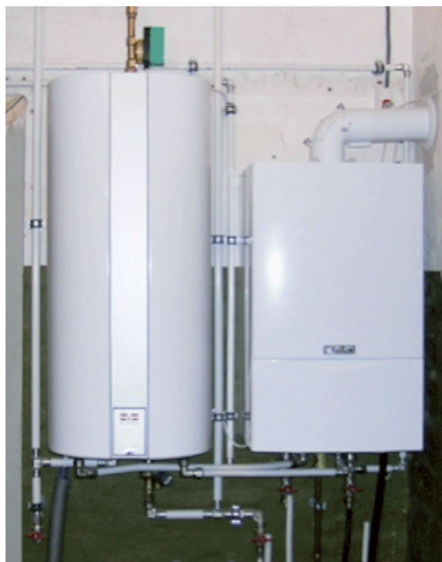
Ny varmtvandsbeholder med ny gaskedel

Når arbejdet er udført, afleveres en brugermanual til kunden. Brugermanualen skal indeholde en beskrivelse af beholderen (inkl. tekniske data), sikkerhedsforskrifter og en betjeningsvejledning.