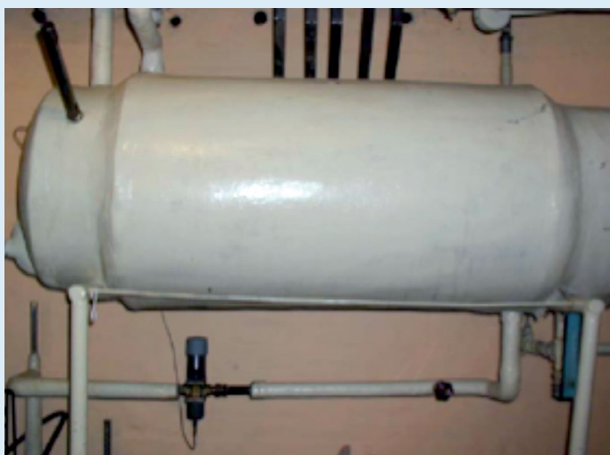
Ældre vandretliggende varmtvandsbeholder

Varmetabene er baseret på en beholdertemperatur på 55 °C og en omgivelsestemperatur på 20 °C. Tabene fra varmtvandsbeholderne er inkl. tilslutninger.