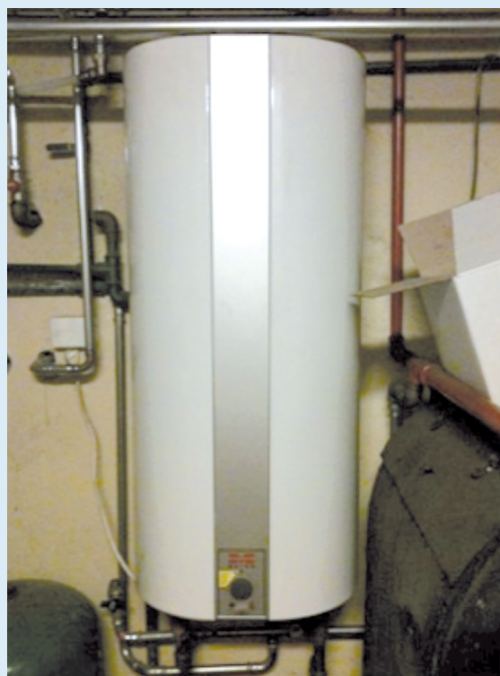
Nyere lodretstående varmtvandsbeholder