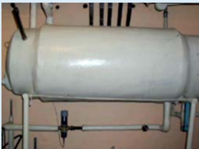
Ældre vandretliggende varmtvandsbeholder

Varmetabene er baseret på en beholdertemperatur på 55 °C og en omgivelsestemperatur på 20 °C. Tabene fra varmtvandsbeholderne er inkl. tilslutninger.