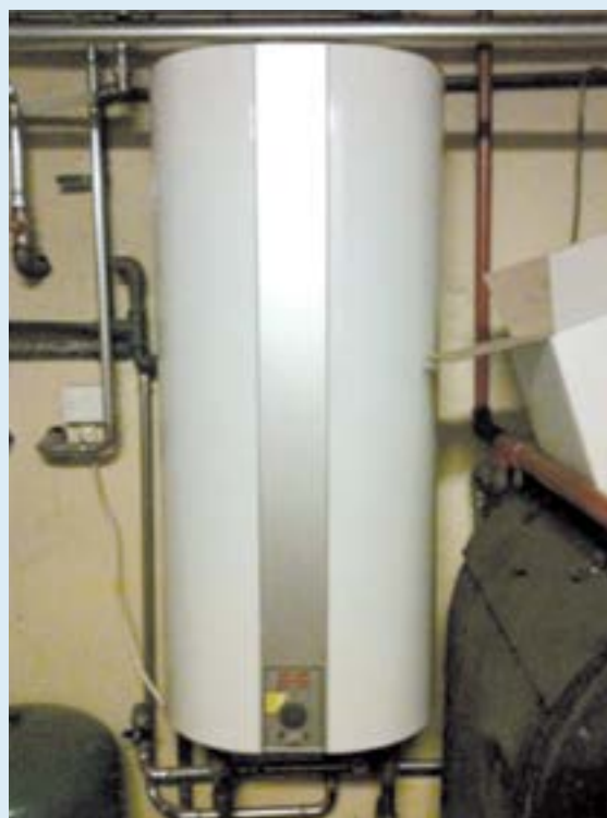
Nyere lodretstående varmtvandsbeholder