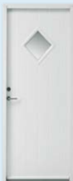
Mindre end 20% rudeandel