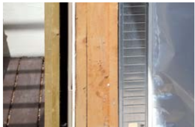
Efterisolering af let ydervæg udført før BR15. Konstruktion set fra ydersiden (venstre): Regnskærm af brædder, hulrum, vindgips, eksisterende træskelet incl. 100-125 mm isolering, ny indvendig isolering i stålskelet, dampspærre og gipsplader.

Dampspærren kan placeres op til en tredjedel inde i den samlede isoleringstykkel fra den varme side. Det muliggør indbygning af stikdåser mm uden, at dampspærren gennembydes.