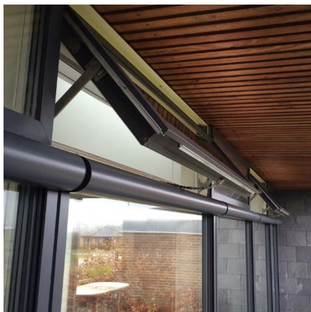
Tophængslet vindue i facade til indtag af luft

Hvis der for eksempel i et 150 m 2 naturligt ventileret enfamiliehus med manuelt styrede vinduer, er et effektivt åbningsareal på 4,5 m 2 med åbninger til alle sider, svarer det til 3 % af etagearealet ved tværv ventilation. Der kan da regnes med en naturlig ventilation om sommeren på: