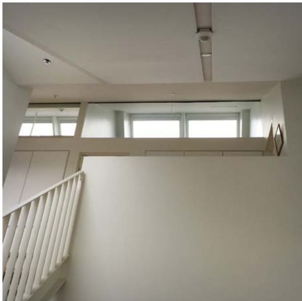
Tophængslet vindue i facade til indtag af luft