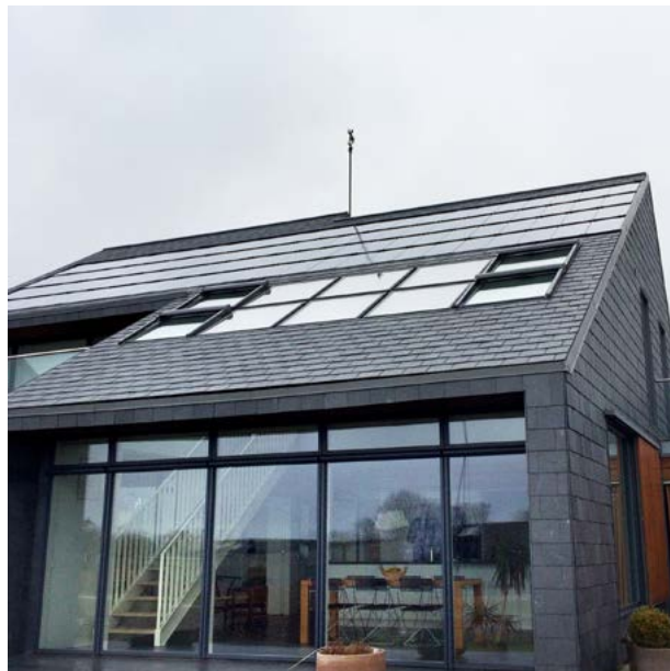
Vippevindue i tag til afkast af luft