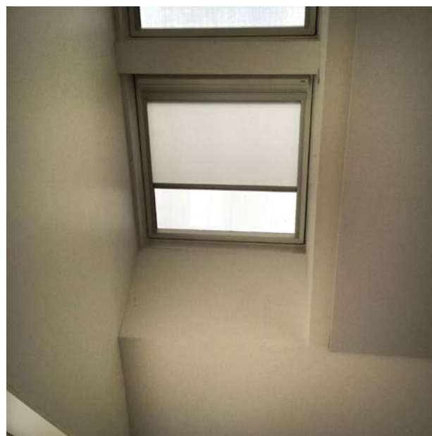
Vippevindue i tag til afkast af luft

Eksempler på disse vinduer ses på nedenstående billeder.